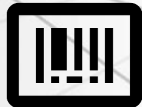
Lettori Codici ean