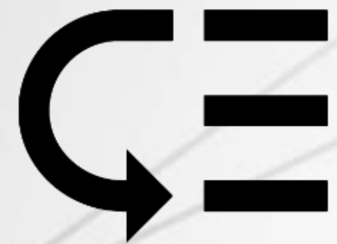
Autorizzazione Multi livello