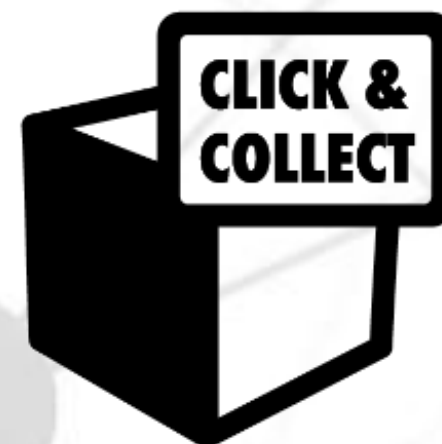
Click & Collect