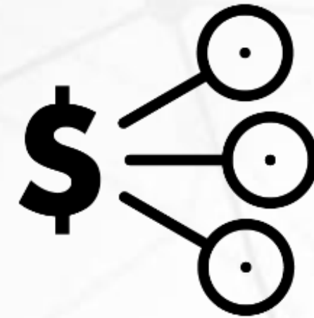
Gestione Centri di costo