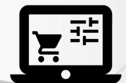
E-Commerce Dedicati *