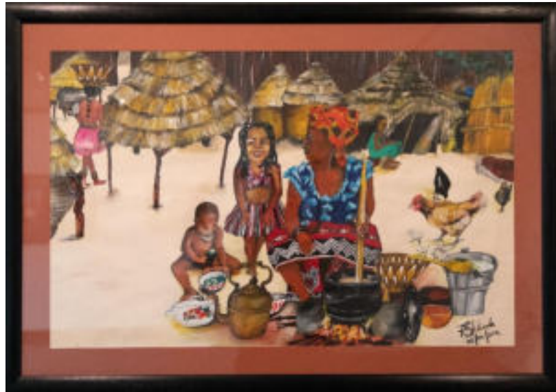
Findano Shikonda Padri assenti 2012 Acrilico su carta 62 x 97 cm Coll. Würth, Inv. 16637