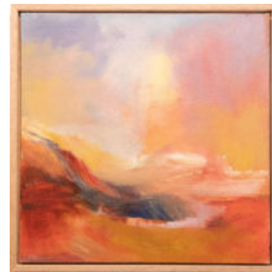
Barbara Böhlke Siccità 2015 Olio su tela 75 x 75 cm Coll. Würth, Inv. 17019