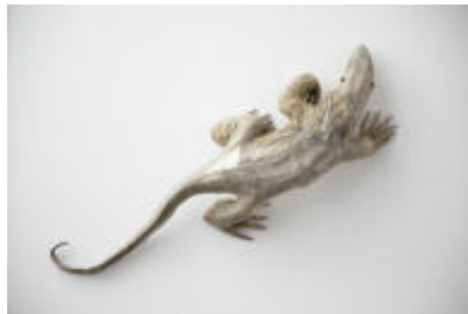
Saima lita Varano 1 2014 Tecnica mista 20 x 135 x 40 cm Coll. Würth, Inv. 17106