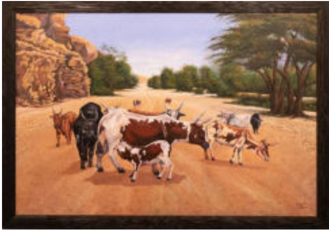
Tity Kalala Tshilumba Il fiume leggendario (Kuseb) 2015 Acrilico su tela 85 x 126 cm Coll. Würth, Inv. 17112

La fauna della Namibia comprende elefanti, rinoceronti, giraffe, zebre, struzzi, antilopi, bufali, ma anche leoni, leopardi e ghepardi. I ghepardi, principalmente a causa del conflitto con l'uomo, nel corso del secolo scorso hanno subito una riduzione numerica del 90%. Oggi questo magnifico felino lotta contro l'estinzione.