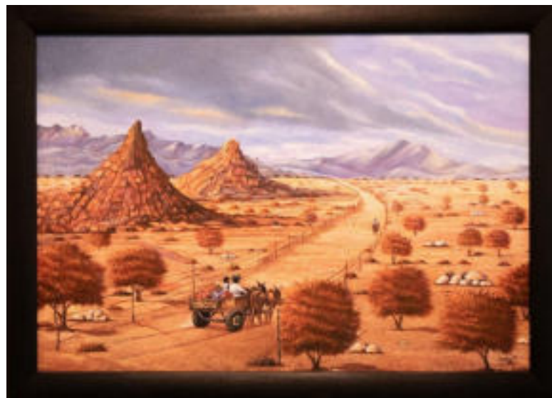
Tity Kalala Tshilumba Strada per Bethany 2014 Acrilico su legno 56 x 81,5 cm Coll. Würth, Inv. 17114