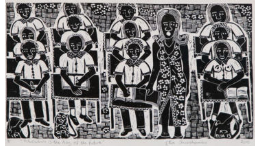
Elia Shiwohamba (*1981) L'istruzione è la chiave per il futuro 2015 Linoleografia 32,5 x 50 cm Coll. Würth, Inv. 17022