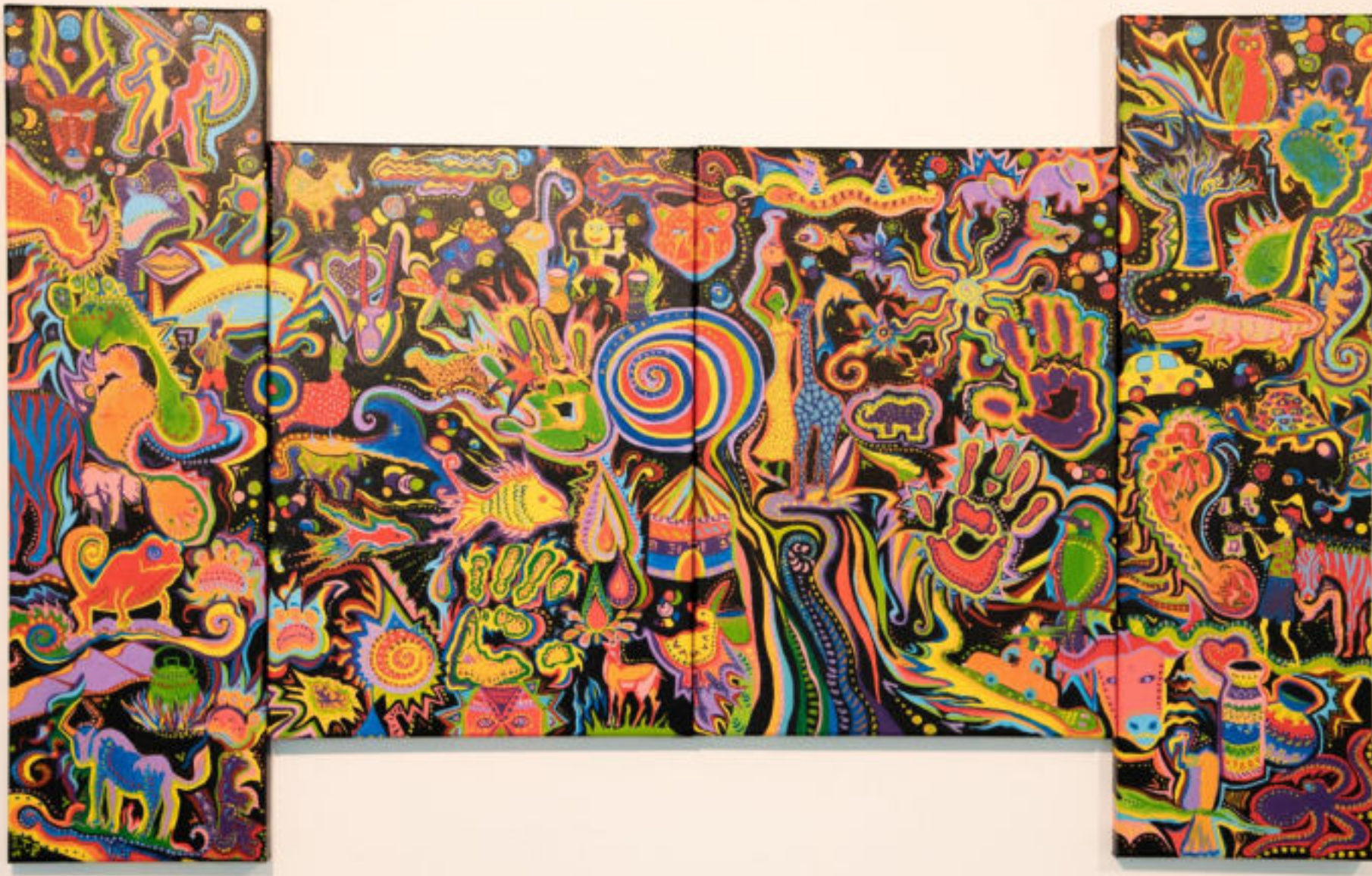
Gisela Farrel Splendida Namibia (dettaglio) 2014 Acrilico su tela 100 x 160 cm Coll. Würth, Inv. 16623