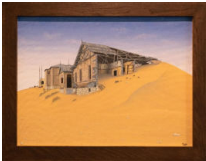
Paul Kiddo Kolmanskop da una nuova angolazione 2014 Acrilico su cartone applicato su legno 44 x 59,5 cm Coll. Würth, Inv. 16630

Il paesaggio varia da regione a regione. Il deserto del Namib occupa l'intera fascia costiera; i diversi toni di rosso e arancio della sua sabbia si devono alla prevalenza di ossidi di ferro. Oltre alle pianure sabbiose, il Paese presenta colline, una serie di altopiani, montagne, savane boschive e canyon.