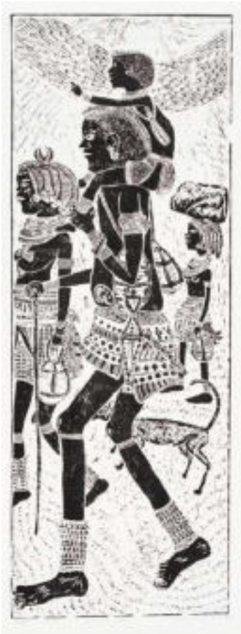
Peter Mwalukange Omuliki Ndjila 2014 Linoleografia 99,5 x 40 cm Coll. Würth, Inv. 17100

La Namibia è una nazione etnicamente e culturalmente composta, popolata da numerosi gruppi etnici locali e da una significativa popolazione di origine europea, sia proveniente dal Sudafrica, sia di tedeschi discendenti dei colonizzatori dell'800. Il Paese conta nel suo complesso ben tredici diverse culture etniche.