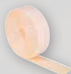
Art. 0899 512 250 blu